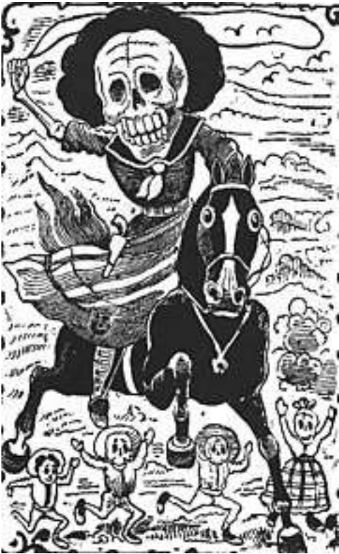
Jose Guadalupe Posada