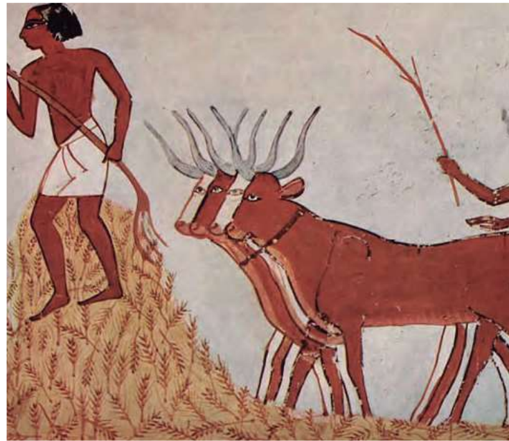
↑ Pintura cámara funeraria. Corte de grano y ganadería