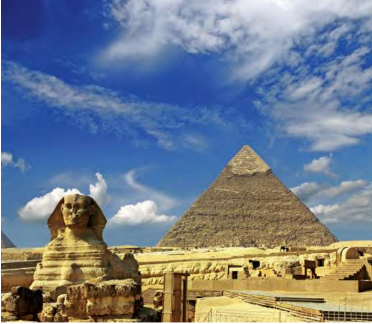
↑ Gran Esfinge de Guiza, Egipto. [Fotografía].

1. Observa las imágenes. Luego, responde.