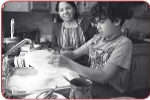
I do the dishes.

see my friends have dinner walk the dog do my homework tidy my room do the dishes