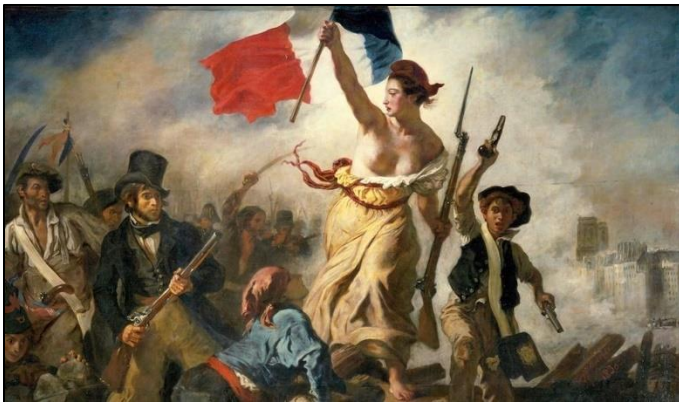
Delacroix, E. (1830). La libertad guiando al pueblo. París, Francia: Museo del Louvre

Clase 2. Objetivo: Analizar las transformaciones políticas y económicas de América y Europa durante el siglo XIX tras el impacto de las ideas Republicanas y Liberales.