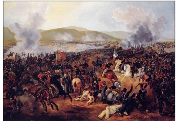
Rugendas, M. (1837). Batalla de Maipú. Santiago, Chile: Museo Nacional de Bellas

En las imágenes anteriores se representan dos hechos históricos ocurridos en dos continentes distintos. Por un lado se muestra la revolución de 1830, donde el pueblo de París se levanta en armas contra el rey Carlos X de Francia, y por otro lado, se exhibe la batalla de Maipú, por la independencia de Chile del Imperio español. ¿Qué aspectos son parecidos en ambos cuadros? ¿Cómo podemos relacionar esto con el surgimiento de las ideas liberales? ¿Podríamos concluir entonces que Latinoamérica quedó aislada de la influencia europea liberal o es más bien al contrario?