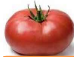
Tomato /tomatou/ Br. /tomeito/ USA