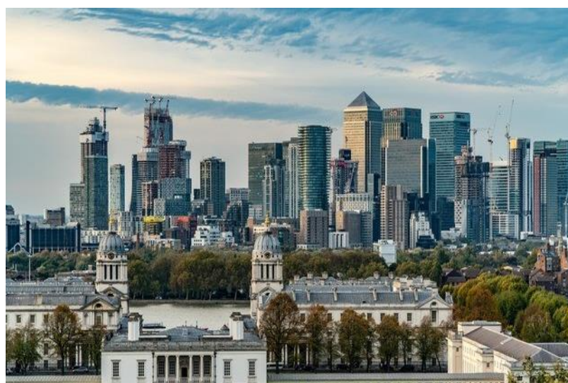
Inglaterra es un país con un alto desarrollo industrial y social.

En cuanto al índice de desarrollo humano, el Programa de las Naciones Unidas para el Desarrollo considera que los países que alcanzan un grado entre 0,50 y 0,79, poseen un índice de desarrollo humano “medio” o “alto”. En 2018, se estimaba que 92 países se encontraban dentro de este rango.